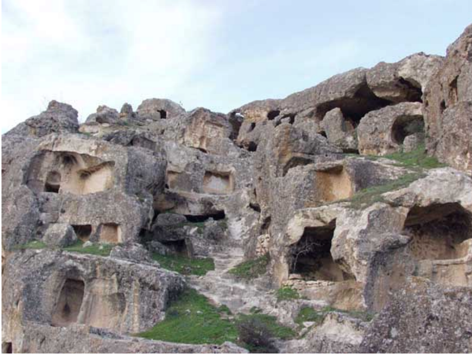
Foto:4. Hassuni vadisinde kayalık merdivenlerle birbirine baęlanan yapılar.