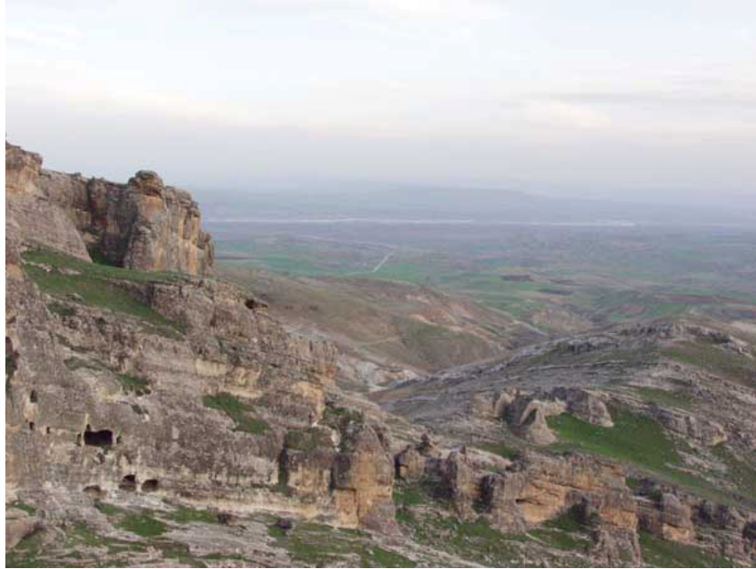
Foto:6. Hassuni vadisinin yukarı kesimlerinden havzaya bakıř. Geri planda batman ayı grlyor.