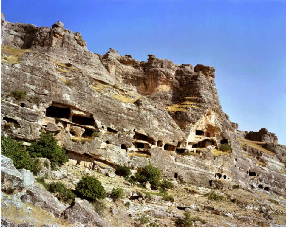
Foto:3. Hassuni vadisinin doęu yamaçları ve çok katmanlı meskenler.