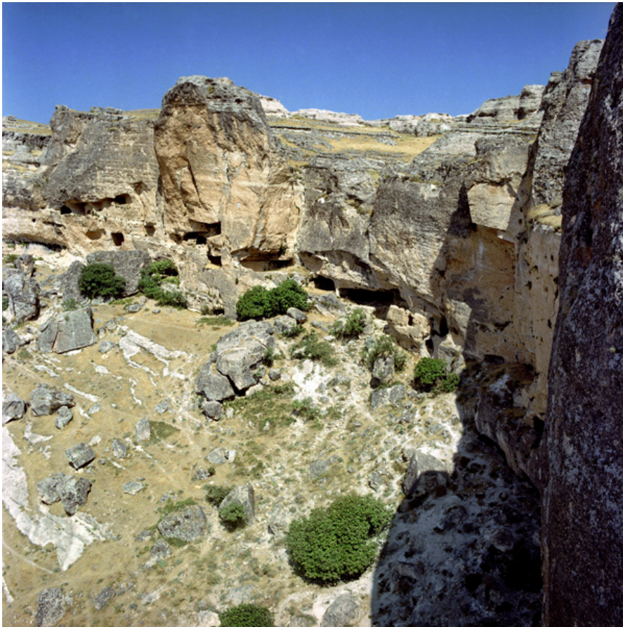
Foto:2. Hassuni vadisinin yarım daire řeklindeki en st kuzey yamaçları ve ktle kopmaları.